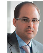
Dr. Gerhard Ries Menold Bezler Rechtsanwälte Partnerschaft, Stuttgart